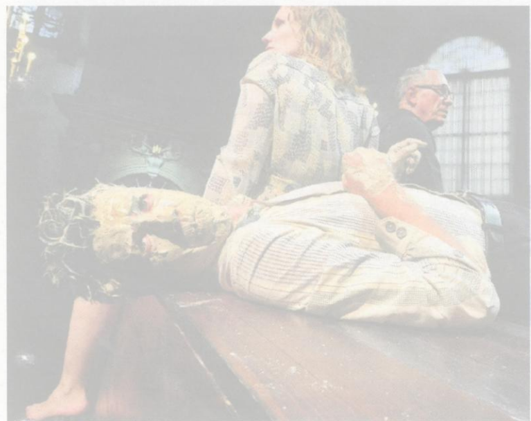
De Zwarte van Walcheren.